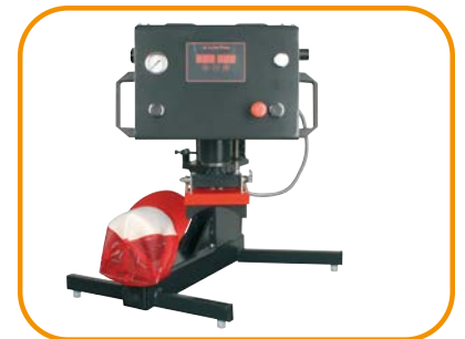
Abb. 3 · Kappenset