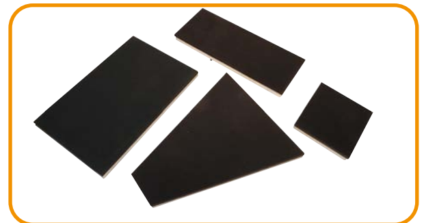
Abb. 5 · Girlie-Platte, längliche Platte, Schirm-Platte, Brusttaschen-Platte

Das Gerät ist auch mit zwei Arbeitsplatten als LTS 750 erhältlich. Die LTS 750 PA bietet zudem einen automatischen Seitenschwenk.