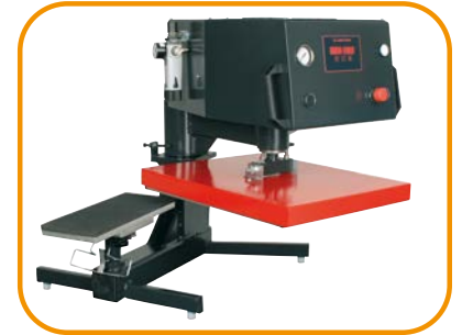
Abb. 1 · Ärmel- oder Hosen-Druckplatte