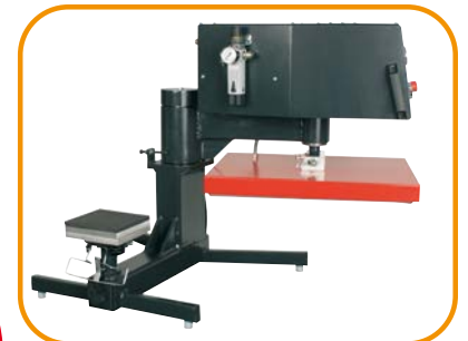
Abb. 2 · Brusttaschen-Druckplatte