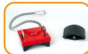
Abb. 6 · Kappenset