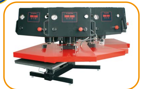
Abb. 4 Großer Schwenkbereich